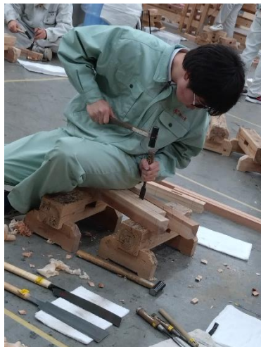
※令和5年度：後期 3級技能検定受検(実技)