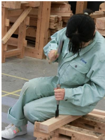
※令和5年度：前期 3級技能検定受検(実技)