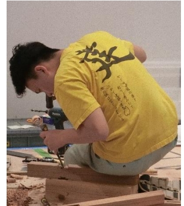
ものづくりコンテスト近畿大会