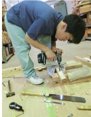
ものづくりコンテスト大阪大会