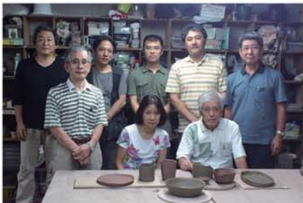
陶芸会・くにたち自游工房にて

関東へ来てから、総会に始まり、各種見学会に参加させていただき、またこの陶芸会でも良い時間・経験を得られました。次回も楽しみにしております。