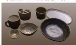
今回参加者の作品