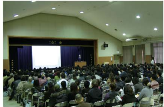
明都館での講演会

会総会には3年前より中部、関東各支部の代表者が招待を受け出席、理事長始め本部署の方々との交流を図らせて頂いています。