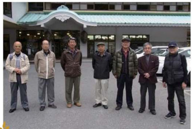
七爺 in 川治温泉

風呂は適度の42度であった。部屋に戻りバタンキュー。果たして、今、爺い婆々の夢か、紅顔の美少年の時かzzz... 翌11日は曇りだ。朝、バイキング朝食。省エネなのか？ 男の従業員一人のみ。8時に正面玄関にて記念写真を撮り、8時12分発の乗合バスにて湯西川温泉駅へ15分程で到着。湯西川道の駅は、地下ずつと下が野岩鉄道の「湯西川温泉駅」一階が待合室、チケツト売場、みやげ物店、レストランで、二階が日帰り温泉である。ビル名は「湯西川みちの駅ビル」果たしてこのビル何階建てなのか。まア、一階は分るが、階段をずーと下に降りると、鉄道の駅。勿論駅まですぐと下に降りると、地下でダム同士パイプで繋がっている。水不足時の対応なのだろう。ダム管理事務所に着き、エレベーターの乗載量の関係で乗員40人、四班に分かれてダム中間部へ。ここは地上60mである。正に狭いところを歩く《キャットウォーク》だ。しかし、一人を除いて大体は工業科、高い所、怖いもの無し。湖の中央からの三方の山は全山紅葉。しかし赤が少くない。常緑樹も少ない。客の誰れかが京都三尾の山の紅葉は日本一と。そう、梅の尾、横の尾、葛の尾だ。京都の山は、杉・松・檜のミドリがあり、その廻りが紅・黄・葉、山裾には真赤なモミジがあつて、