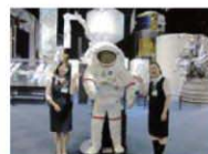
JAXA 筑波宇宙センター