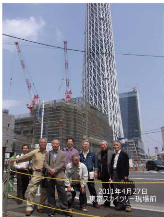
東京スカイツリー現場前