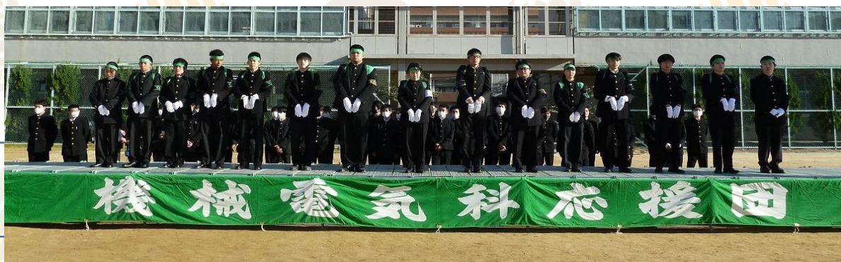
2020年の応援団の様子 分散しての演舞だった