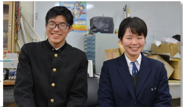
取材に応じてくれた2人と、 2020年の応援団

演舞の全部ができてないから、やりたい！新拍子を考える楽しさとか経験してない。みんなと一緒にやりたかった！！