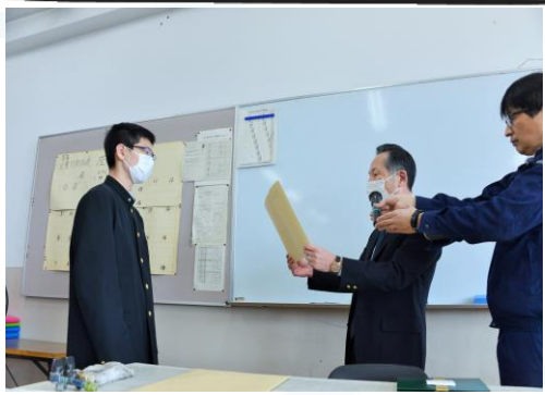
マスク姿での卒業記念品贈呈

令和元年八月二十日に船井電機様から機械電気科に六五吋大型4Kテレビを寄贈いただき、機電棟三階CAD実習室へ設置調整を完了いただきました。