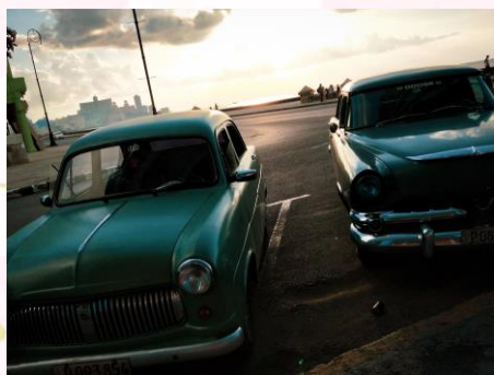
カリブ海に沈む夕日とアメ車

私は昨年、カナダへ留学に行った。留学自体は半年間だが、その前後で 20 カ国、50 都市以上に行き、バックパッカースタイルで世界一周もした。その中で、カリブ海に浮かぶキューバという国を訪れたことがあった。キューバは今も社会主義体制の国家で、近年ようやく少しずつ自由経済を導入し始めた国だ。