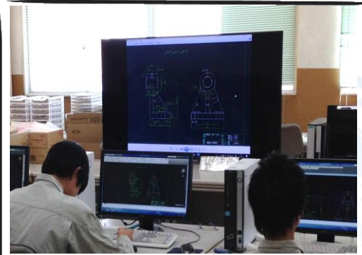
船井電機様から寄贈頂いたTV