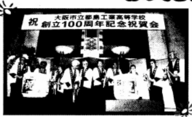
平成19年11月10日・記念祝賀会 場所:帝国ホテル