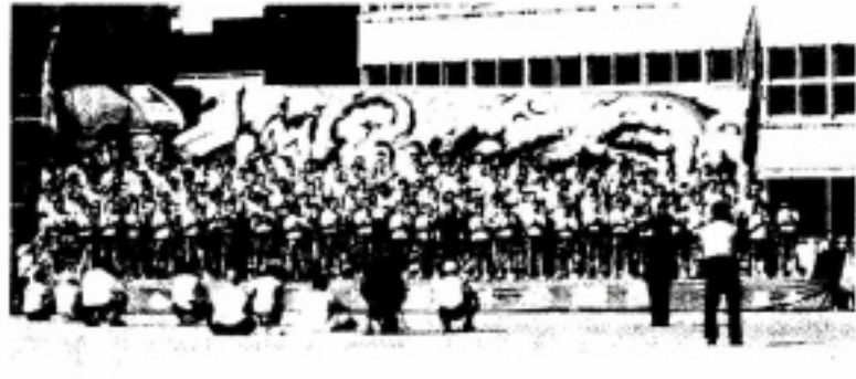
平成15年10月18日・体育祭