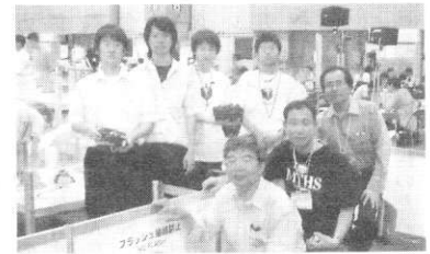
平成17年7月16日 2005年大阪世界大会

引続き機械電気科高田 科長より機電科の近況報 告をしていただきました。 第2部として今年度の懇 親会は青嵐会、舎密会と 3部会が初めて合同で懇 親会を開催しました。他 科の懐かしい同窓生の顔 も見られ盛大裏に終了し ました。