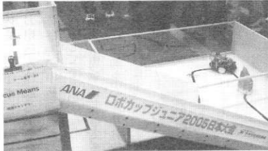
平成17年5月4日 2005年東京日本大会

わけて所属の科が決定する 期で所属の科が決定する として実施されています。後 3年前より機械科と総合 り機電科の新生募集は さて、皆さまへ存知の通 に驚きを禁じ得ません。 校関係者の「先見の明」 趣旨がこのように現実化 昭34年機電科創設の でしよう。