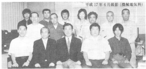
平成 17 年 6 月撮影 (機械電気科)