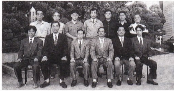
平成八年度機械電気科は、次の職員で生徒の指導にあたります。